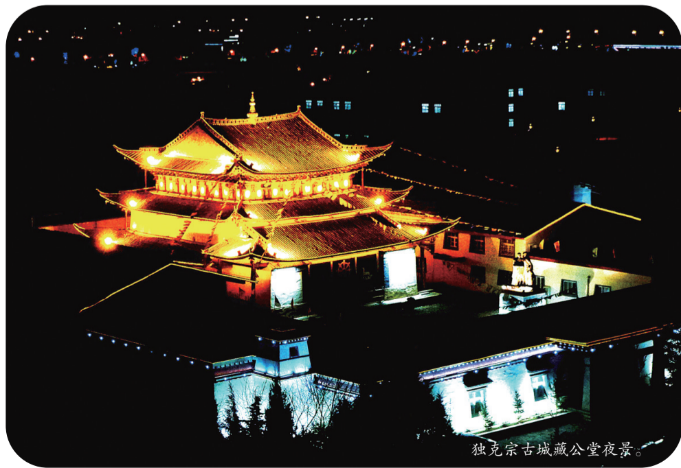
独克宗古城藏公堂夜景。

从历史上讲,维西县城塔城戈登村发现的古文化遗址证实:早在七八千年前的新石器时代,迪庆境内就有藏族先民居住,繁衍生息,多以部落为居,如尼汝属卡(尼汝部落)、碧农属卡(碧农部落)等。其中,“独克宗”也是一个部落单位。直到公元7世纪初期,松赞干布先后兼并境内诸部落,统一全境,建立吐蕃王朝。后来吐蕃众兵南下与唐朝和南诏征战,于唐仪凤、调露年间(公元676年—679年),在维西其宗设神川都督府,在迪庆境内金沙江上架起吐蕃铁桥,建立东西十六城,“独克宗”为其中之一,作军事要塞,也是历史上著名的铁桥东城之一。到了公元13世纪中叶,元朝统一了全中国,也统一了整个藏族地区。迪庆藏族居住地方隶属吐蕃等路宣慰使司都元帅府,仍沿用吐蕃时期的建制,“独克宗”也作为军事要塞。明朝以后,丽江木氏土司在中央皇权的支持下,长期染指康南藏族地区,历经100多年,先后将大批纳西族迁入迪庆,“独克宗”作为纳西族兵驻守的军事要塞。清康熙六年(1667年)蒙古和硕特部固始汗的军队占领滇川涉藏地区,并将滇川涉藏地区敬献给五世达赖喇嘛为香火地。中甸受固始汗和五世达赖喇嘛的双重统治,并设置“宗”。从此,“独克宗”演进为县一级的行政机构。