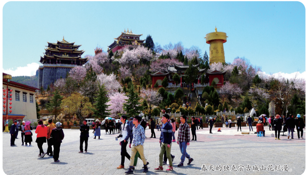
春天的独克宗古城山花烂漫。

从语言上讲,“独克宗”这一藏语古地名可以解释为:“独”藏语意为一是石头,二是要点,主要部分;“克”藏语本意为官家住处,引申义为城堡、山寨、碉楼;“宗”藏语意为一是堡垒、山寨、要塞,二是县级行政区或治所(在西藏元代已有此制)。“克宗”藏语意为碉堡、石堡,多修建于山头等地的坚固堡垒。